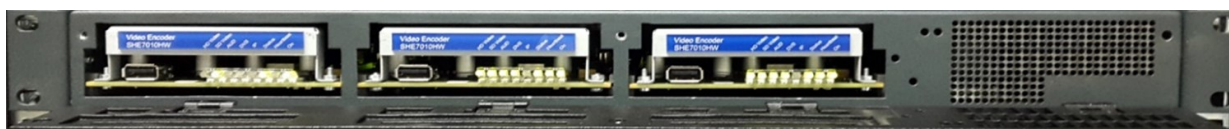
Sivac-one Frame Frontal cubierta abierta