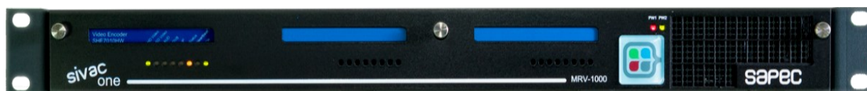
Sivac-one Frame Frontal cubierta cerrada

Sivac-one Frame permite el acceso físico directo a las tarjetas insertadas a través del frontal para facilitar el mantenimiento y la operación. En esta línea, el chasis cuenta con un sistema de cambio automático entre fuentes redundantes extraíbles en calientes, que a su vez incorporan alarmas software y hardware.