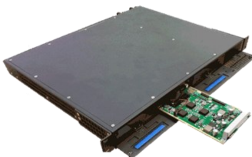
Detalle de inserción de SMP en Sivac-one Frame